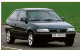
Opel Astra F

Etliche Volumenmodelle, wie der Opel Astra F oder auch der Volvo 850, erhalten in diesem Jahr das begehrte H-Kennzeichen. Oder auch der exklusive Bentley Continental R oder der bei Porsche in Zuffenhausen endmontierte Mercedes-Benz 500 E. Spätestens in den 90ern wichen opulente Chromzierteile zunehmend, und schwarze Kunststoffteile hielten Einzug bei vielen Modellen.