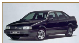
VW Passat VR6 (B3)