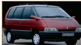
Renault Espace (Serie 2)