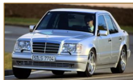
Mercedes-Benz 500 E