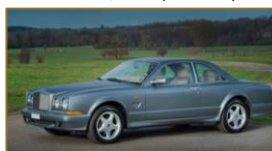
Bentley Continental R

Sie sind auf der Suche eines neuen Oldis? Schreiben Sie uns, wir helfen gern.